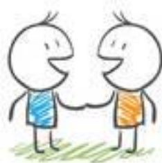
Handshake and communication